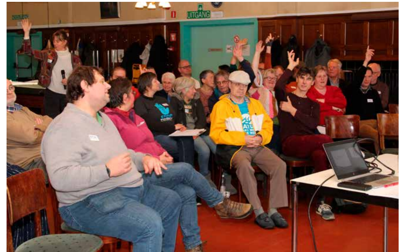
▲ 'Stress is een sluipend gif.' Kunnen omgaan met stress is belangrijk.

Bij de screenings voor kanker zijn er mensen die niet deelnemen. Bij baarmoederhalskanker valt op dat vrouwen uit lagere sociale klassen minder deelnemen terwijl ze meer risico lopen. Het team van professor Willems zocht naar de motieven, ook door groepsgesprekken met betrokken vrouwen. Niet deelnemen blijkt zelden een weloverwogen beslissing. Wat als vrouwen de mogelijkheid krijgen om het uitstrijkje zelf af te nemen? Testkits werden gestuurd naar vrouwen die langdurig niet gescreend waren. In een tweede onderzoek werden vrouwen aangesproken door de huisarts, als ze daar langsgingen voor iets anders, en konden ze een testkit meekrijgen of de test ter plaatse zelf afnemen. De folder met uitleg is ontwikkeld samen met mensen in armoede: duidelijke taal, pictogrammen, een QR-code om naar een website te gaan waar de tekst in 13 verschillende talen te vinden is en filmpjes die tonen hoe je het doet. Het onderzoek is nog niet afgerond, maar dit is al duidelijk: een groter percentage vrouwen doet mee aan de screening.