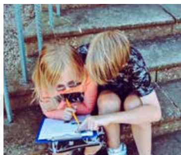
03 Twee maten, twee gewichten

ATD | ALL TOGETHER FOR DIGNITY | SAMEN VOOR WAARDIGHEID