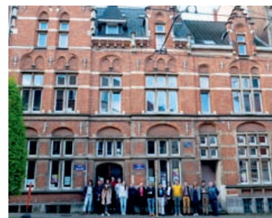
08 Steun ons