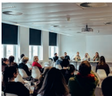
04 Van oude naar nieuwe spelregels

ATD | ALL TOGETHER FOR DIGNITY | SAMEN VOOR WAARDIGHEID