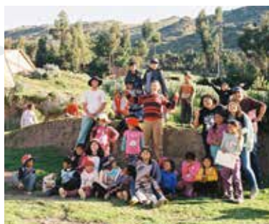
06 De weg naar Peru