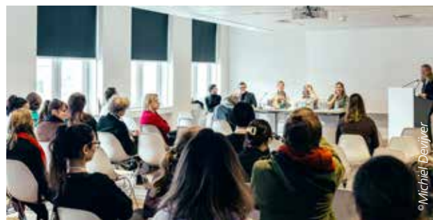
▲ Met een delegatie van ATD Vierde Wereld namen we deel aan de conferentie voor een rechtvaardige transitie

WOONZAAK. Meer dan vijftig organisaties stapten naar het Europees Comité voor Sociale Rechten in Straatsburg en dienden een klacht in tegen het Vlaamse woonbeleid.