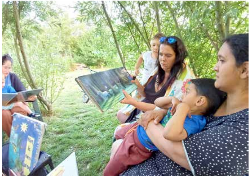
▲ “Durf te investeren in de toekomst van kinderen en jongeren”

Er gaat te weinig aandacht naar de 18-tot 25-jarigen. Heeft dat te maken met het stereotiep dat jongeren nog veel veerkracht hebben? Of dat je ze niet te veel mag verwennen – anders blijven ze te lang afhankelijk van hun ouders of van uitkeringen? In het voorbije decennium heeft het beleid hen wel erg streng aangepakt: door opeenvolgende besparingsmaatregelen hebben heel wat schoolverlaters geen recht meer op werkloosheidsuitkeringen. Geen wonder dat ze dan bij het OCMW aankloppen. Maar zelfs dat is niet evident. Hoewel de wet bijvoorbeeld toelaat