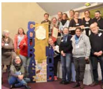
04 Respectvolle hulp

ATD | ALL TOGETHER FOR DIGNITY | SAMEN VOOR WAARDIGHEID