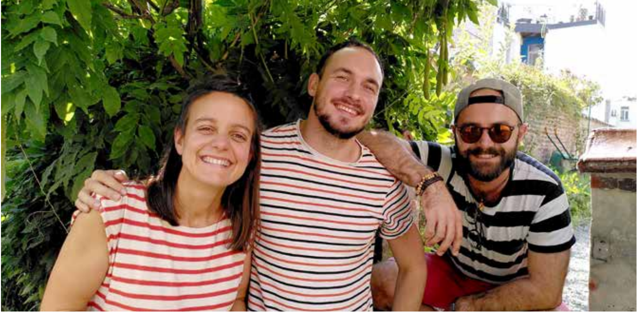
▲ Afgelopen jaren konden we verschillende jongeren laten kennismaken met ATD Vierde Wereld.