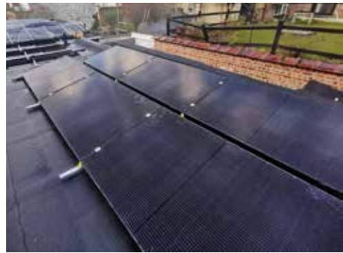
▲ De daken kregen in 2023 isolatie, bedekking en zonnepanelen. Dit jaar starten er grotere werken om onze werk- en ontmoetingsplek energiezuiniger te maken.