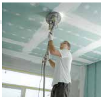
06 Wanneer de baksteen op je maag ligt