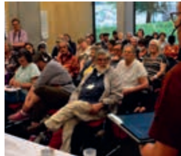
07 Op bezoek bij de RVA