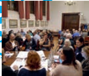
04 Aan tafel met het stadsbestuur

ATD = All Together for Dignity / Agir Tous pour la Dignité / Samen voor waardigheid www.atd-vierdewereld.be / Nr. 222 / maart 2023 / Verschijnt vier maal per jaar