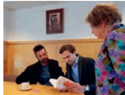
11 Recht op bescherming van het gezin