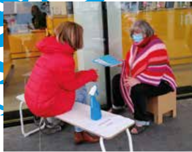
04 Levende Bibliotheek

ATD = All Together for Dignity / Agir Tous pour la Dignité / Samen voor waardigheid www.atd-vierdewereld.be / Nr. 220 / september 2022 / Verschijnt vier maal per jaar