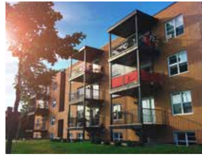
10 De woonzaak