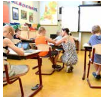
06 Elke leerkracht een brugfiguur