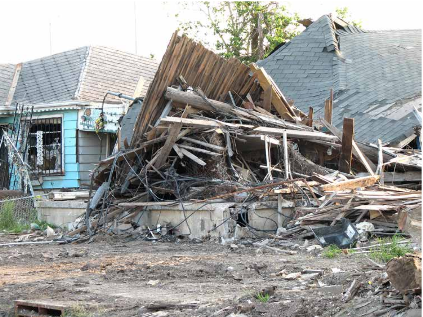
▲ De ravage na orkaan Katrina in New Orleans was enorm