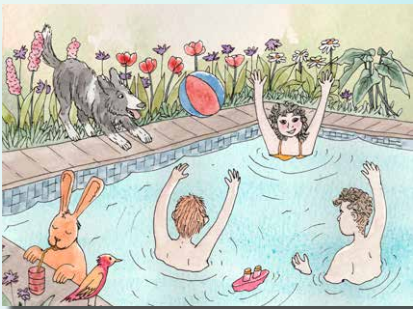
▲ 5 Zwembad