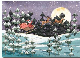
▲ 2 kerst