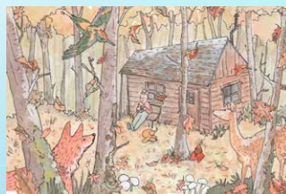
▲ 10 Herfst