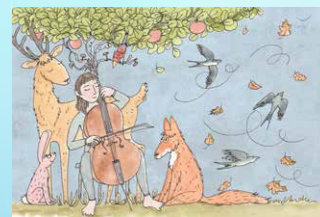
▲ 11 Zwaluwen