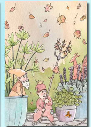
▲ 8 Tuinkabouters