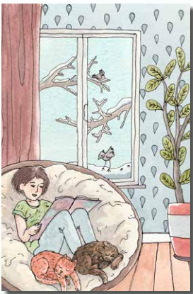
▲ 1 Regen

Bestellen kan via onze webshop, telefonisch (02/647.92.25) of per mail (boekhandel@atd-vierde-wereld.be). Indien je telefonisch of per mail bestelt, maak je het bedrag over aan ATD Vierde Wereld België vzw op rekeningnummer IBAN: BE89 0000 7453 3685 (BIC: BPOT-BEB1) met vermelding "wenskaarten + je naam + je adres".