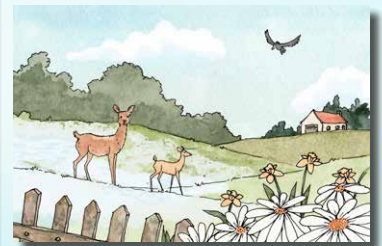
▲ 4 Lente