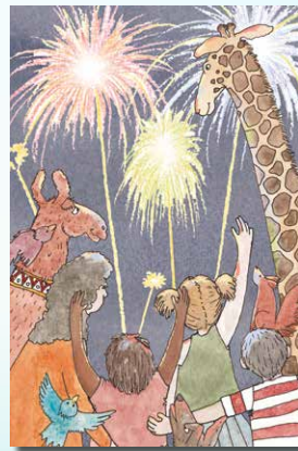
▲ 3 Vuurwerk