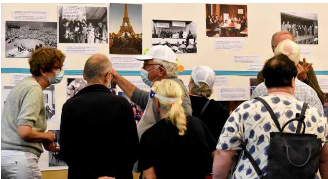
▲ Op de expositie over de geschiedenis van ATD Vierde Wereld in België konden mensen oude foto's en documentatie bekijken.