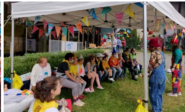
▲ Ondertussen ontfermden enkele animatoren zich over de kinderen.