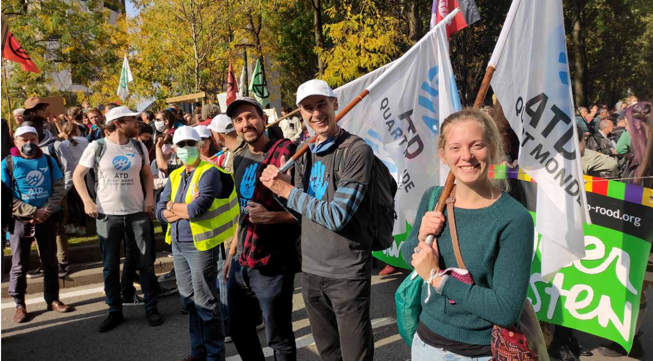
▲ Een delegatie van ATD Vierde Wereld op de klimaatbetoging van 10 oktober