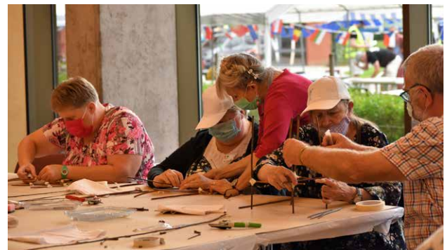
▲ Na een gezamenlijk middageten en een plenair gedeelte konden onze leden kiezen uit verschillende workshops. Zo was er de workshop lantaarns maken voor 17 oktober.