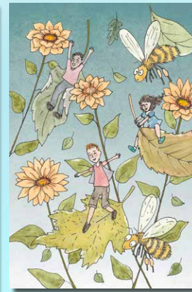
▲ 7 Zonnebloemen