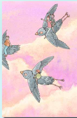
▲ 6 Duif