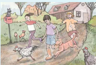
▲ 9 Kip