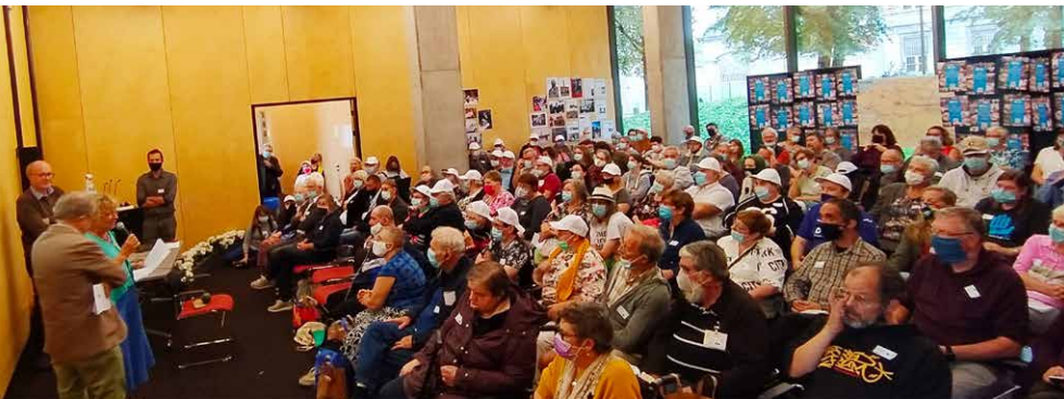
▲ Enkele pioniers van de laatste 50 jaar namen het woord en er was een voorstelling van het strategisch plan van ATD Vierde Wereld België voor 2021 – 2025. Een plan waar veel leden aan hebben meegewerkt.

ATD Vierde Wereld België vierde op zondag 26 september haar vijftigste verjaardag. We waren talrijk aanwezig in Brussel om onze verwezenlijking van de voorbije jaren te vieren en samen uit te kijken naar de toekomst.