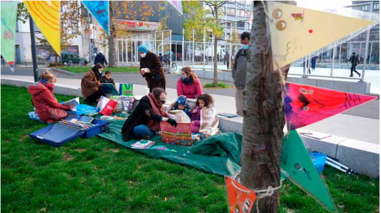
▲ Straatbibliotheek in Sint-Gillis

Om maar te zeggen dat die laagdrempelige aanwezigheid, met boeken op een pleintje of fotoprojecten in het park, ook andere zaken mogelijk maakt. De straatbibliotheek is nu aanwezig in de Brusselse gemeentes Sint-Joost en in Molenbeek, en in Charleroi. We zoeken vooral wijken of pleinen waar geen andere organisaties actief zijn, maar wel veel kinderen buiten spelen bij gemis aan een eigen tuin. Langdurige aanwezigheid op een plek geeft ons ook inzicht in de armoede in die omgeving, we ontdekken zowel mechanismen van uitsluiting als van solidariteit. Mooi is als onze volgehouden actie erkenning krijgt, anderen inspireert. Zoals in Sint-Gillis, waar de openbare bibliotheek en een gemeentelijke wijkorganisatie na 4,5 jaar de 'boeken'animatie nu overnemen.