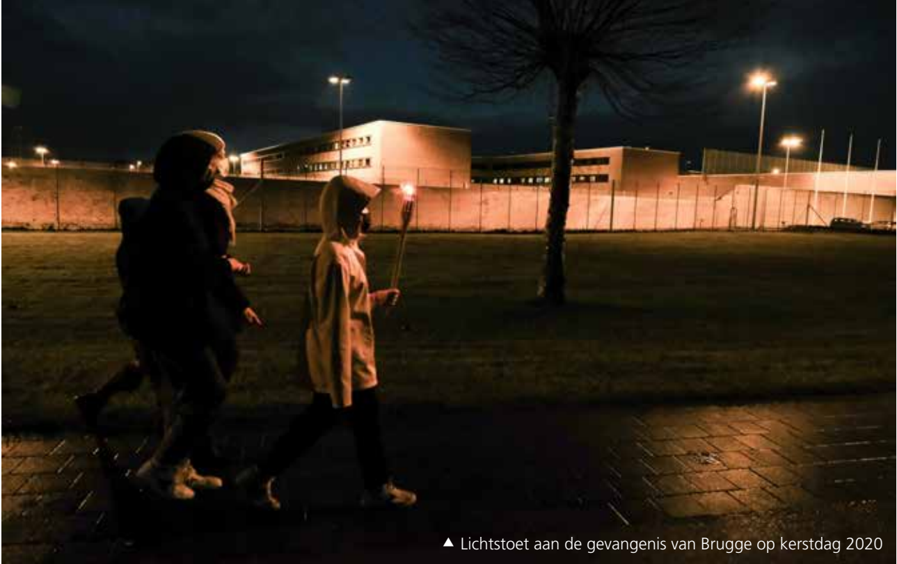
▲ Lichtstoet aan de gevangenis van Brugge op kerstdag 2020

Gevangenisren runnen is peperduur -150 euro per gedetineerde per dag - en de resultaten zijn bedroevend slecht. Nadenken over hoe het beter kan is een politieke en morele noodzaak.