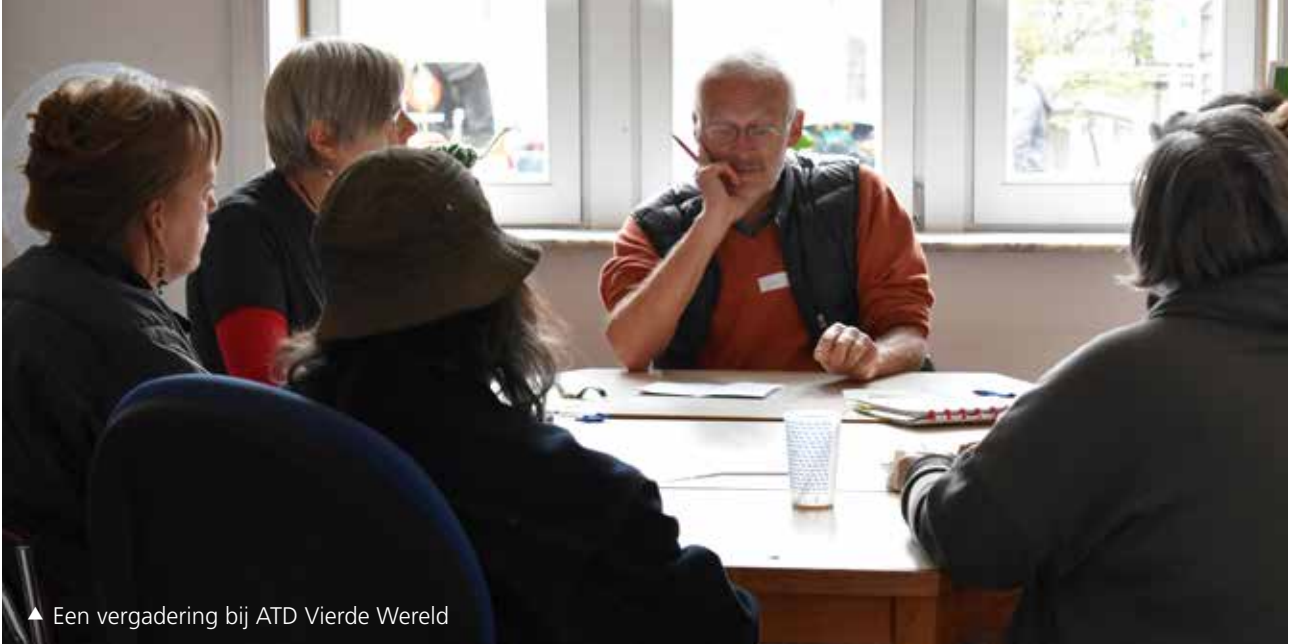
▲ Een vergadering bij ATD Vierde Wereld