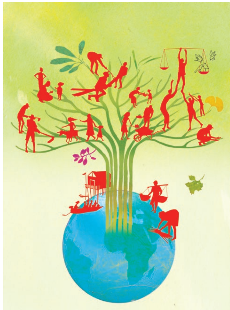
▲ Tekening: H el ene Perdereau