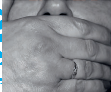
03 Lach je tanden bloot

ATD = All Together for Dignity / Agir Tous pour la Dignité / Samen voor waardigheid www.atd-vierde wereld.be / Nr. 212 / september 2020 / Verschijnt vier maal per jaar