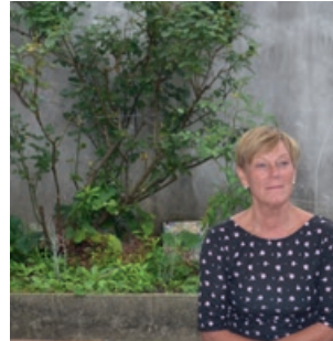
04 Vertrek vanuit een engagement zonder vooraf te oordelen