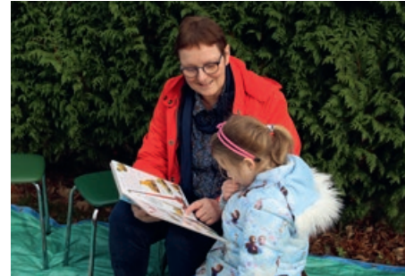
07 De basisopties werden mijn graadmeter