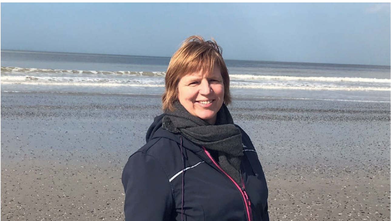
▲ Na het werk nog een wandeling. Zalig!

Vanavond enkele kaartjes schrijven en een telefoontje naar mijn ouders, allebei een eind in de tachtig. Het is hard dat