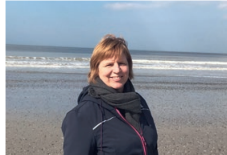
08 Zoeken naar een aangepaste vaarroute