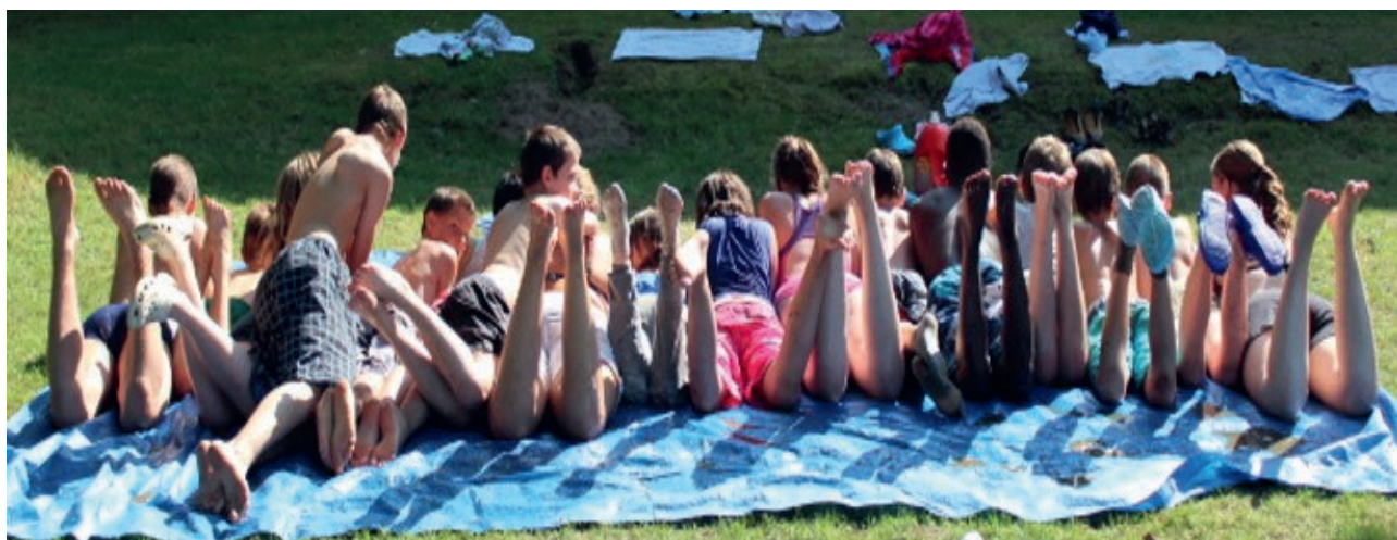
▲ Het zal wennen zijn om deze zomer meer afstand te houden

'De studenten halen leuke 'vertederende' grapjes uit. Het is één april, nietwaar? Vanmorgen een aantal dringende betalingen uitgevoerd en de loonprestaties doorgegeven.' Net voor het middageten heffen we het glas met kidibull. De Takel bestaat vandaag 32 jaar! Welke tijden het ook zijn, in