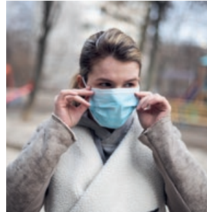
06 De afstand overbruggen