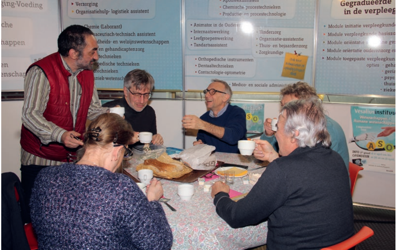
▲ Een gezellige sfeer op de volksuniversiteit over gezondheid

“Lockdown? Laat me niet lachen, ik leef al heel mijn leven in lockdown. Voor ons, mensen in armoede, is dat dagelijkse kost. Misschien dat de andere mensen nu eindelijk eens gaan beseffen wat wij meemaken”.