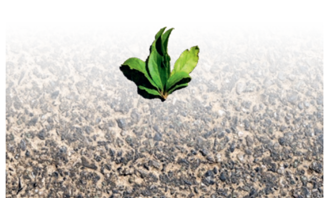
▲ Groen of grijs, een wereld van verschil

Rapport 'Duurzaamheid en Armoede' op www.armoedebestrijding.be