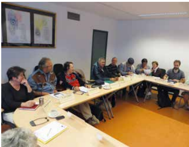
▲ Overleg bij het Steunpunt