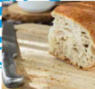
03 Kiezen is een luxe

ATD = All Together for Dignity / Agir Tous pour la Dignité / Samen voor waardigheid www.atd-vierdewereld.be / Nr. 209 / december 2019 / Verschijnt vier maal per jaar