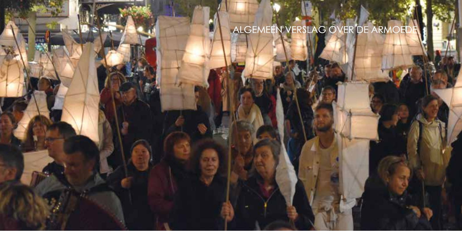
▲ Een optocht met lampionnen op de Werelddag van Verzet tegen Extreme Armoede te Brussel (17 oktober 2019)

voor de stem van mensen die in armoede leven. “Wij willen geen speciale rechten voor de mensen die in armoede leven, wij willen een samenleving waarin wij als volwaardige burgers worden erkend.” Hulpverleners kregen de gelegenheid om te vertellen hoe zwaar hun taak kan wegen: “de crisis beheren, want een maatschappijproject dat verder reikt, is er niet.”