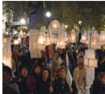
06 Hoopvol, moe, geduldig, en soms wanhopig: onze stem groeit traag