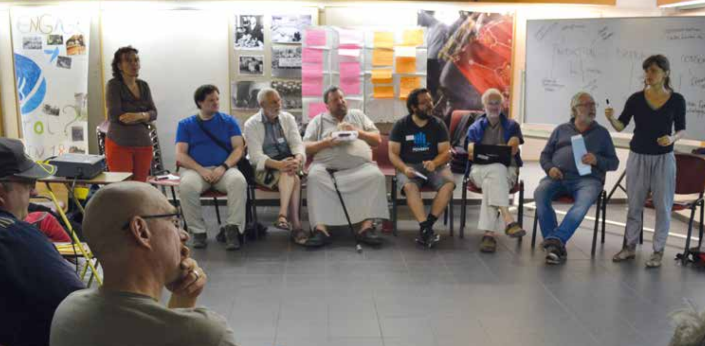
▲ Samen de dialoog voorbereiden