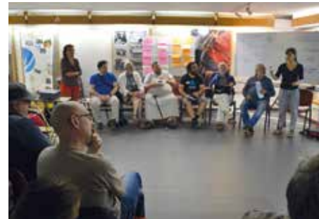
08 Het verslag van een dialoog tussen mensen in armoede en het beleid