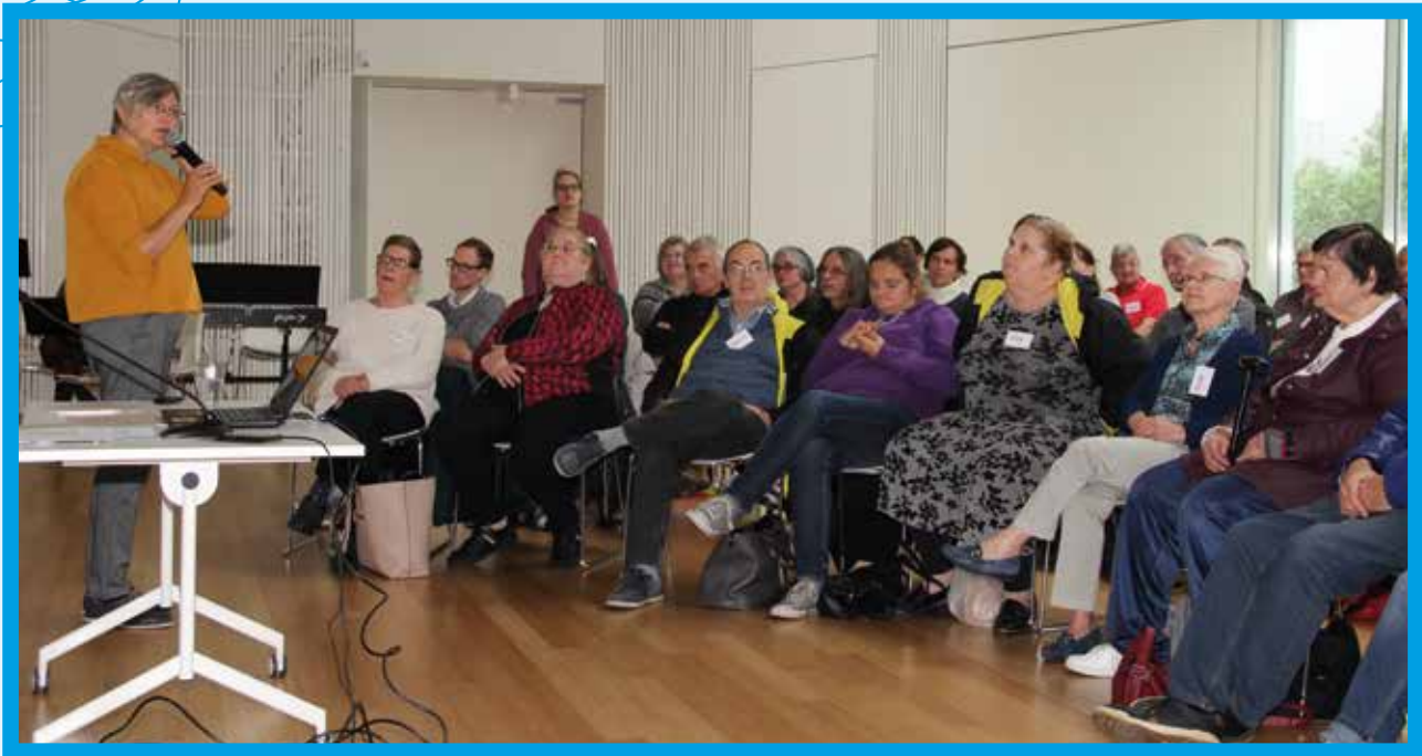
Veel volk op de Volksuniversiteit van 5 oktober. Het thema was samenleven met mensen met een migratieachtergrond.