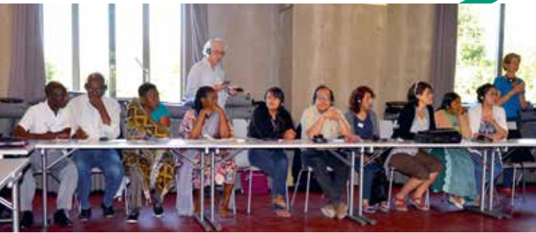
▲ Delagatie Tanzania en Bolivia

“LEVEN IN ARMOEDE IS EEN HINDERNISSENPANCOERS WAARBIJ JE MINDER MIDDELEN HEBT DAN ANDEREN. DE IMPACT LAAT ZICH VOELEN IN ALLE DIMENSIES VAN HET LEVEN. HET IS EEN DAGELIJKSE STRIJD MET ENORME OBSTAKELS, HET IS LEVEN VAN DAG TOT DAG”