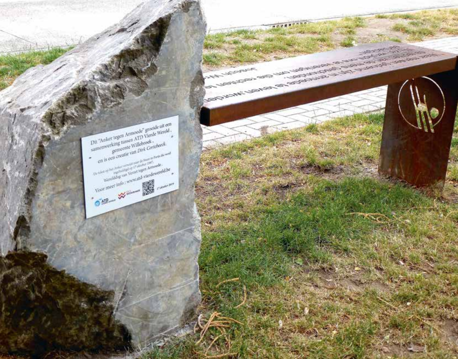
▲ Anker tegen Armoede in Willebroek