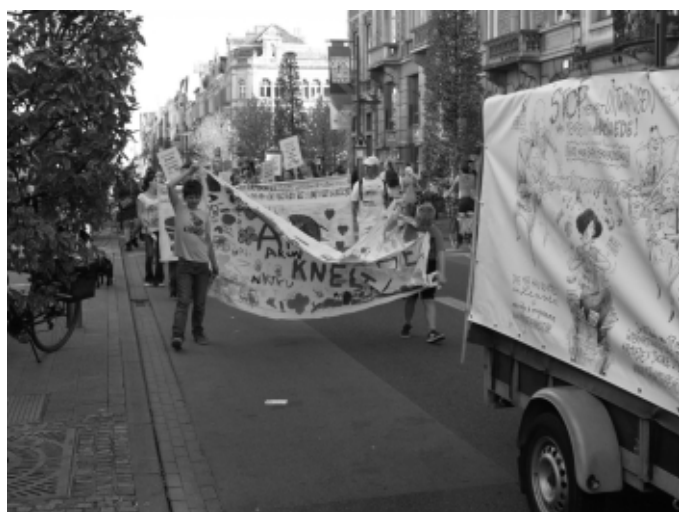
Leuven: optocht tegen armoede