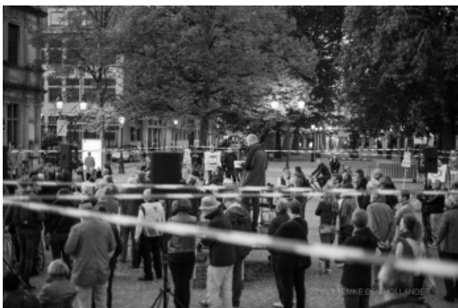
Brugge: opbouw van het armoedeweb met getuigenissen en politieke oproep

Oostende - ATD Kust maakt deel uit van de stedelijke werkgroep 17 oktober. Op woensdag 17 oktober werd het jaarlijkse "Soep'an d'horloge" georganiseerd in het Leopoldpark: ontmoeting met soep.