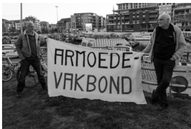
Hasselt: herdenkingsmoment in het Volkstehuis