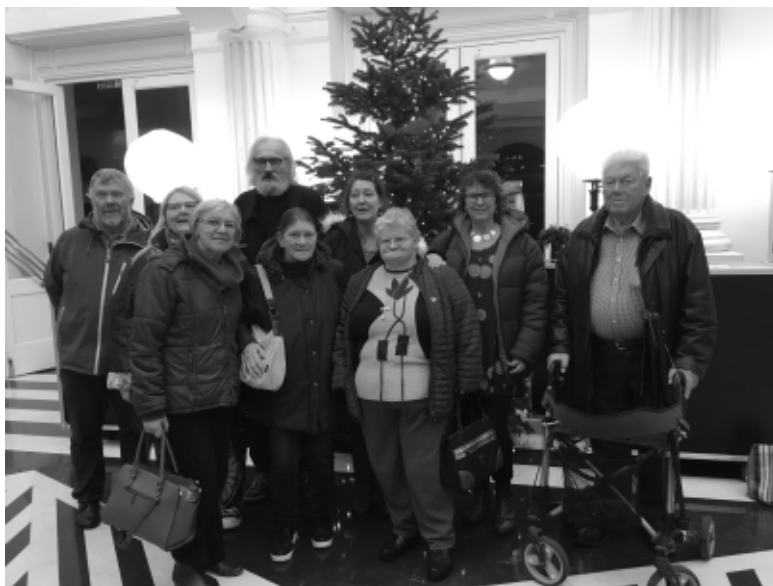
Leden uit Ronse en Oostende gaan naar de opera in de Muonschouwburg

Lokaal organiseren de verschillende groepen laagdrempelige uitstappen voor de leden van de groep. De groep in Oostende organiseert elk jaar samen met CAW & JZ-Middenkust, BMLIK-O, KAAP-CM en inloophuis Kwiedam een nieuwjaarsreceptie. Op deze receptie waren in 2018 een 120-tal personen aanwezig, van wie 80 in armoede. Op woensdag 1 augustus ging de groep naar 2 voorstellingen van Theater aan Zee: "Onze Koen" in CC De Grote Post rond het thema opvoeden van kinderen en de moeilijkheden dat dit met zich meebrengt en "Chasse Patate" over verlies in het leven en volhouden.