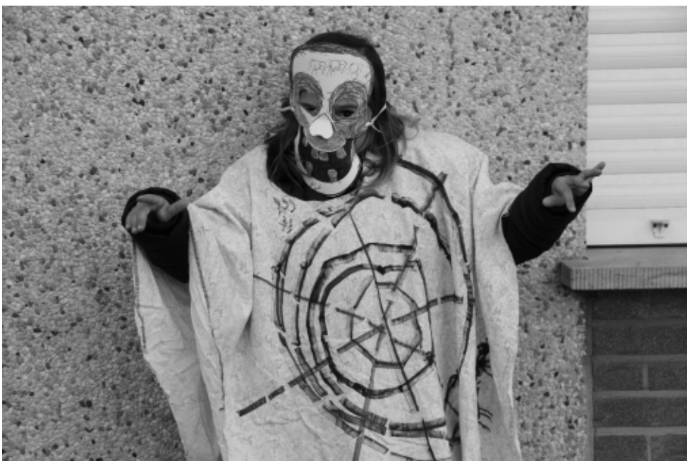
Thema Halloween tijdens de straatbib in Bossuit

Een vrijwilliger in Brugge die lid is van de medestandersgroep bezoekt geregeld gevangenen. Dit zijn vaak mensen in een armoedesituatie.