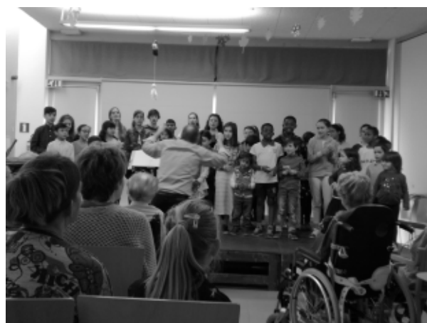
Lint: optreden van het kinderkoor verbonden aan de muziekcademie van Antwerpen