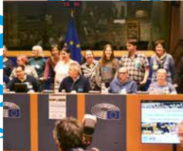
04 Europa en het gezin

ATD = All Together for Dignity / Agir Tous pour la Dignité / Samen voor waardigheid www.atd-vierdewereld.be / Nr. 206 / maart 2019 / Verschijnt vier maal per jaar