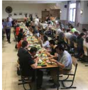
6 Een Gezinsbond voor iedereen