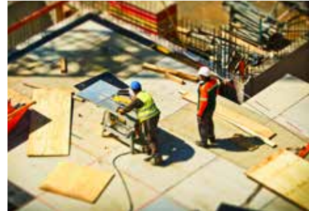
08 Sociale huisvesting is een gouden geschenk