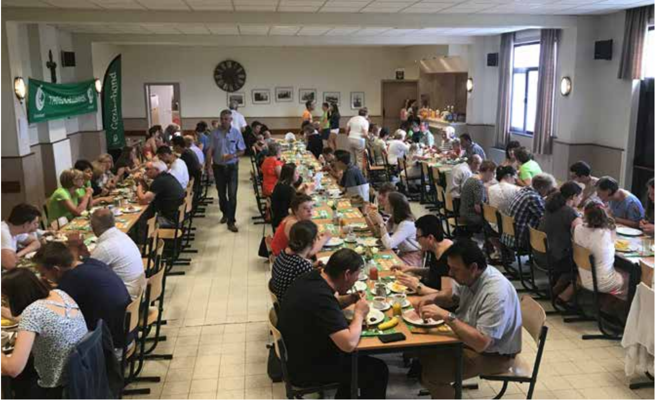
▲ Ontbijt voor iedereen.