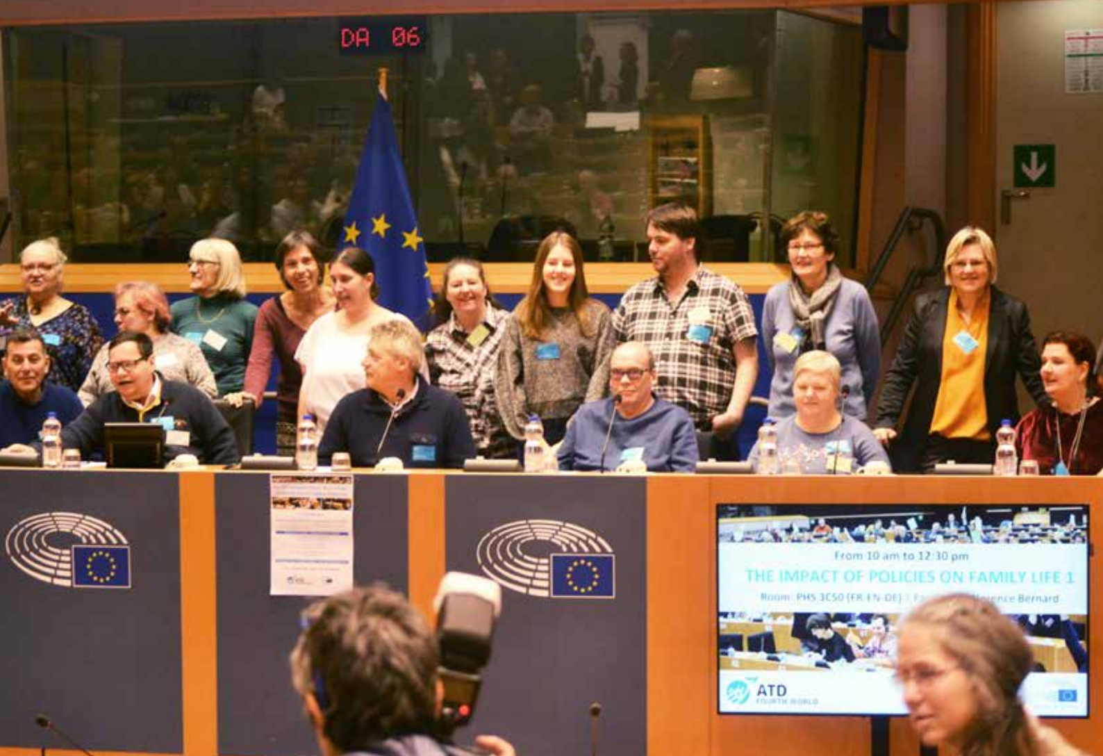
▲ Onze delegatie in het Europees Parlement