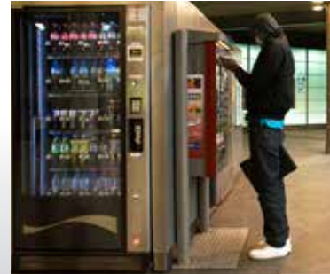
10 Mededeling aan de reizigers