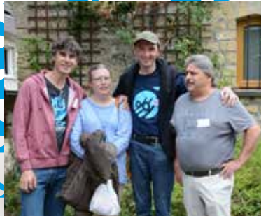
06 Samen roeien om vooruit te raken

ATD = All Together for Dignity / Agir Tous pour la Dignité / Samen voor waardigheid www.atd-vierdewereld.be / Nr. 205 / december 2018 / Verschijnt vier maal per jaar