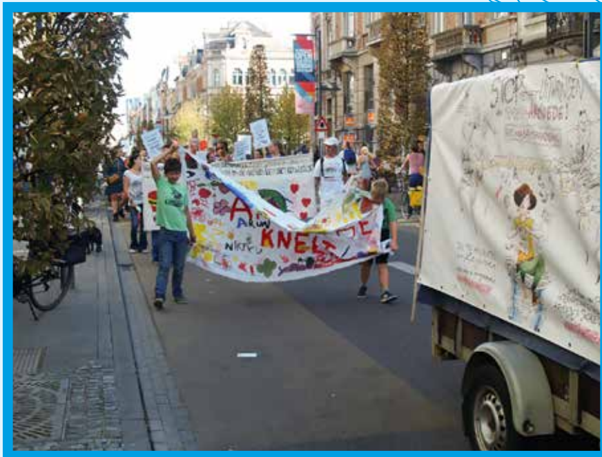
▲ Meer dan 700 mensen namen deel aan de optocht tegen armoede in Leuven op 13 oktober.