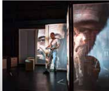
08 Verbeelding kan de wereld redden