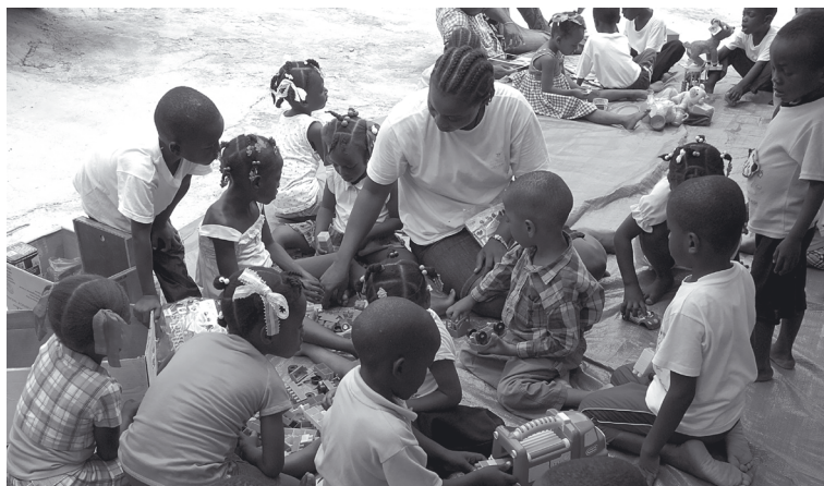
ATD Vierde Wereld kon inmiddels het project "Pré-école" voor kinderen tussen 3 en 6 jaar opnieuw starten.