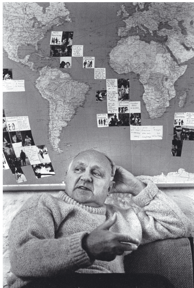
Joseph Wresinski: "Wat op de eerste plaats komt is de waardigheid van de mens die in armoede leeft."

met de bus. En telkens herhaalt zich hetzelfde tafereel. De bus stopt. Aan de ene kant, achter de busramen, zitten de passagiers. Aan de andere kant de mensen die aanschuiven voor hun enige maaltijd van die dag. Ik kijk weg want ik zie dat ze zich schamen. Het zijn normale mensen, met waardige gelaatstrekken, gevoelig, intelligent. En tegelijkertijd zijn ze overgeleverd aan de blik van het publiek, ze dragen een stempel. Hoe goed de bedoelingen ook zijn, de liefdadigheid vernedert hen, slaat hen met uitsluiting.