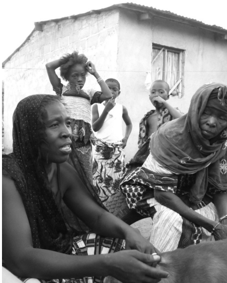
Ook de ouders zijn betrokken bij de straatbibliotheek in Bouaké.