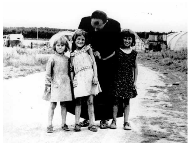
▲ ATD ontstond in het barakkenkamp in Noisy-le-Grand, nabij Parijs (F). Joseph Wresinski: ‘27 liefdadigheidsverenigingen waren er actief. Dit liet ons toe een andere aanpak te kiezen’.

“Waar mensen gedoemd zijn in armoede te leven, worden de Rechten van de Mens geschonden. We zijn verplicht ons te verenigen om die rechten te doen eerbiedigen.” Joseph Wresinski