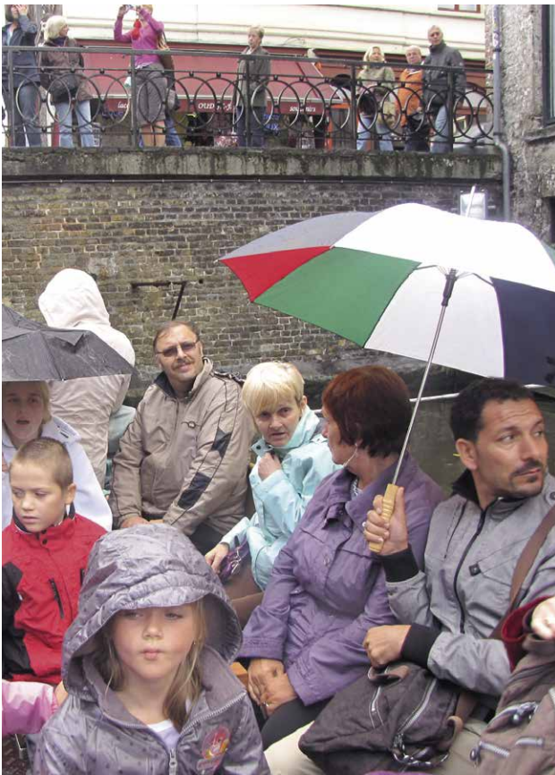
▲ Augustus 2011: op uitstap naar Brugge, een fantastische dag, ons aangeboden door de Brugse medestandersgroep.