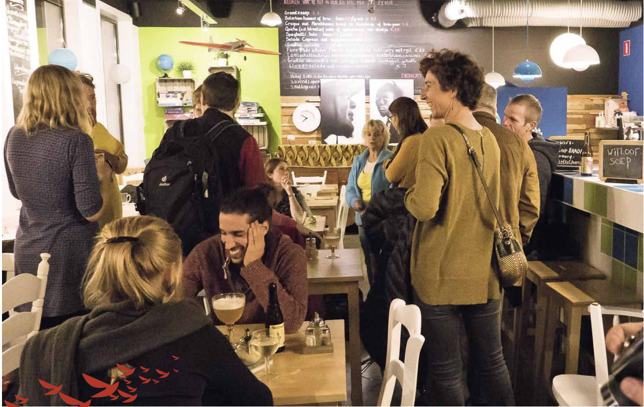
Een gezellige start in het Wereldcafé ▲