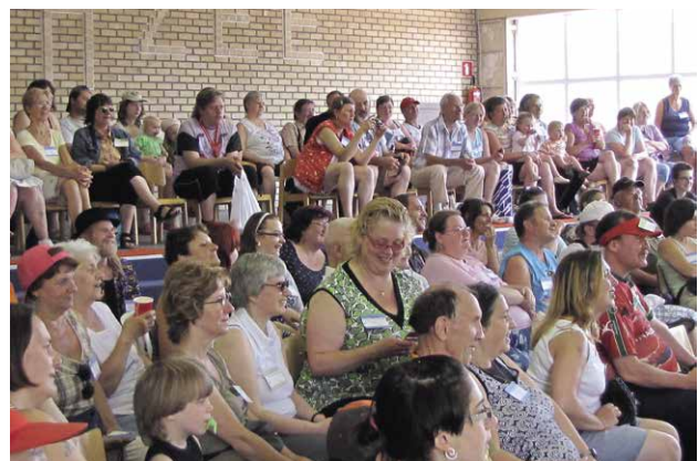
▲ Juni 2010: gezinsdag in Oostende. Uit alle hoeken van het land komen gezinnen verbonden met ATD Vierde Wereld naar deze ontspannende dag. Een van de vele activiteiten: een show van een knotsgek gezelschap.