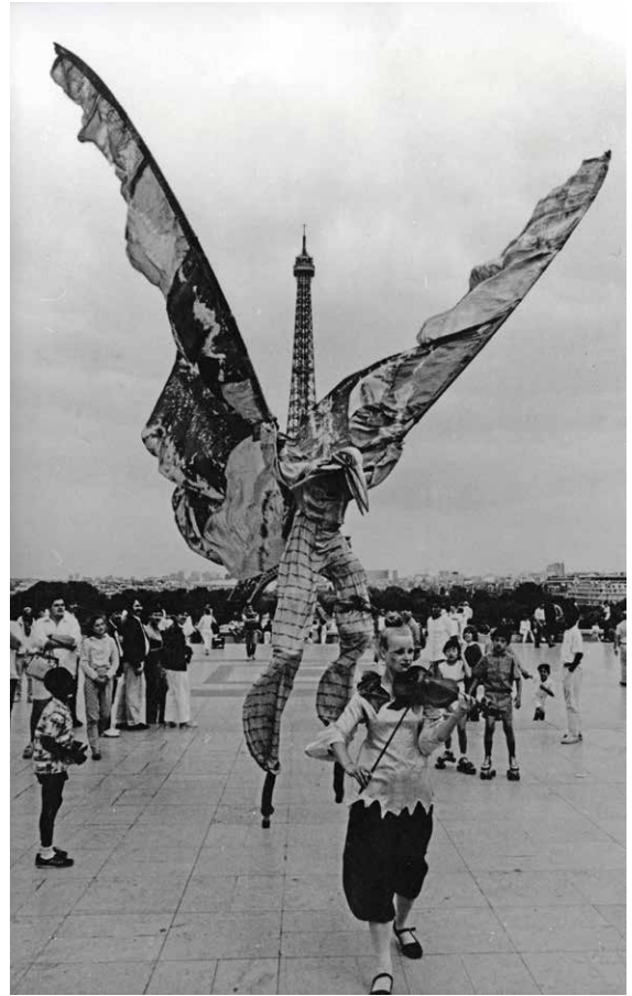
▲ Parijs, 17 oktober 1987, eerste Werelddag van Verzet tegen Armoede. 100.000 verdedigers van de Rechten van de Mens.

Dit leidde tot het ontstaan van de Werelddag van Verzet tegen Extreme Armoede. De campagne 2017 wil deze groeiende beweging van samenwerking en inzet versterken en verruimen.