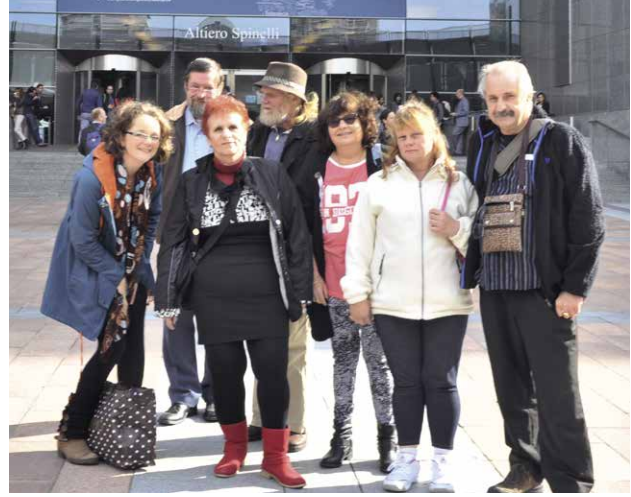
▲ 2014: Een delegatie uit Oostende neemt deel aan de Europese Volksuniversiteit van de Vierde Wereld.