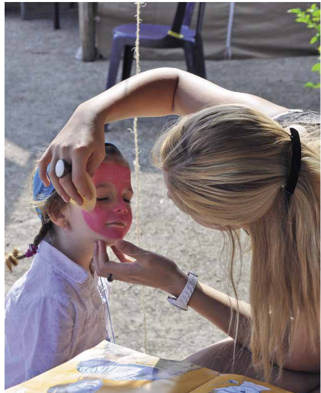
▲ September 2013: Komterbie, ons twejaarlijks ontmoetingsfeest, in samenwerking met inloopcentrum Kwiedam, Beweging van Mensen met een Laag Inkomen en Kinderen, CM Kaap en Samen Divers. Met tal van activiteiten en workshops.