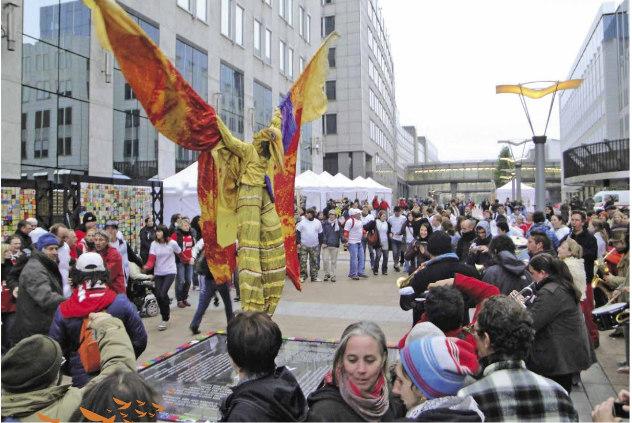
Brussel, 17 oktober 2010, Gedenksteen bij de Europese instellingen. ▲