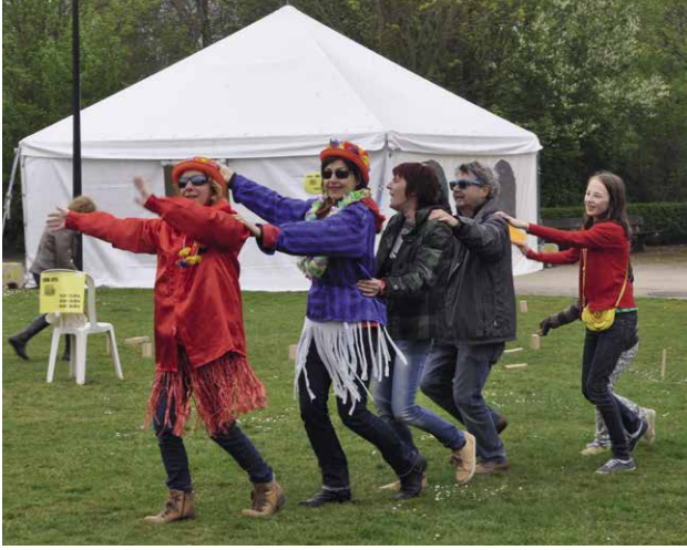
▲ Komterbie 2015- ambiance! ▲