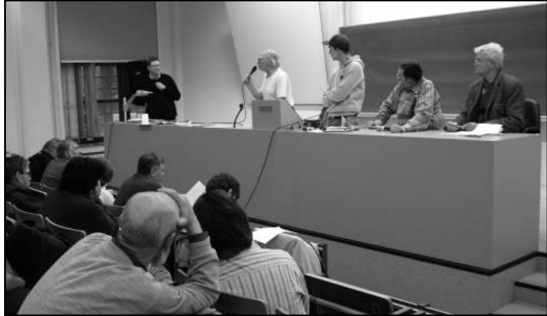
De projectgroep van Centrum Kauwenberg presenteert het dossier 'Schuldbemiddeling ontoereikend!?' in de Volksuniversiteit van april in Antwerpen.

Dat dit soort gedegen onderzoek nodig is, blijkt ook geregeld uit allerlei actuele publicaties: “Ongeveer 140.000 Vlamingen deden vorig jaar een beroep op schuldbemiddeling. Opvallend is dat ook steeds meer mensen uit de middenklasse zich in de rode cijfers werken. Het gaat vooral om achterstallige huurgelden, energierekeningen, telecomproblemen, schoolrekeningen en ziekenhuisfacturen”, aldus een artikel onlangs in Metro.