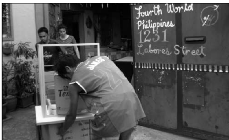
Een beeld van een verhuizing bij ATD Vierde Wereld in Manilla.

De Filipijnen is een eilandengroep met 91 miljoen inwoners. Een derde daarvan leeft in armoede. De hoofdstad Manilla bulkt van