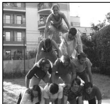
Jongeren uit heel Europa ontmoeten elkaar tijdens zomerse werkweken (Foto: Jos Delisse).

60 jaar Universele Verklaring van de Rechten van de Mens