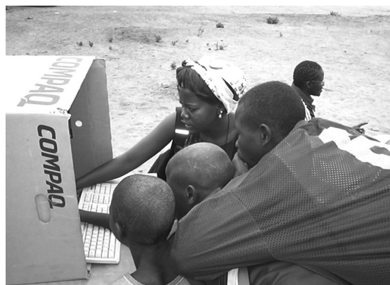
Vooral in Afrikaanse landen, zoals bijvoorbeeld in Senegal op de foto, is de digitale achterstand dramatisch.

Ook voor de Internationale Beweging ATD Vierde Wereld is het internet inmiddels onontbeerlijk. Volontairs, medestanders én mensen in armoede maken er continu gebruik van om informatie en berichten van solidariteit en hoop uit te wisselen.