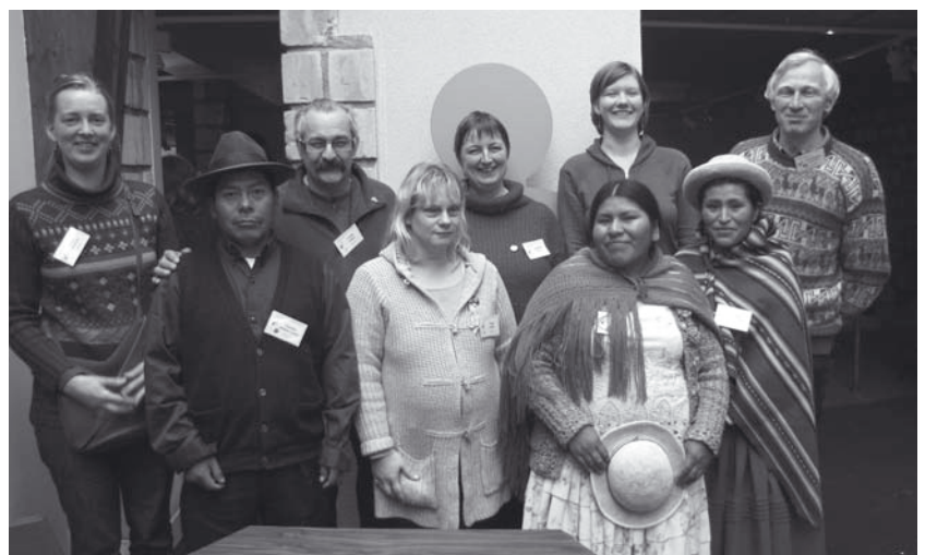
Een bijzondere ontmoeting tussen deelnemers uit Bolivia en Vlaanderen. “Wij hoorden voor het eerst over plaatsing van kinderen, zeiden de Bolivianen. Dat raakte ons diep. In ons land bestaat dit niet. Kinderen worden door de lokale gemeenschap of familie opgevangen.”

Na een eerste moment van herkenning of ongeloof, zochten we in de groep naar het onrecht in elk verhaal. En vervolgens naar de gebaren van moed. In de namiddag gingen we een stap verder. We