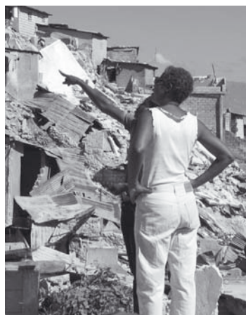
Leden van het team van ATD Vierde Wereld in Port-au-Prince op zoek naar mensen en gezinnen die zij kennen

Op onze (inter)nationale websites plaatsen we zoveel mogelijk actuele informatie: – www.atd-vierdewereld.be – www.atd-fourthworld.org – www.atd-quartmonde.org Indien u een gift wilt doen voor onze acties in Haïti, kunt u gebruik maken van het in de colofon genoemde nummer o.v.v. 'Haïti'.