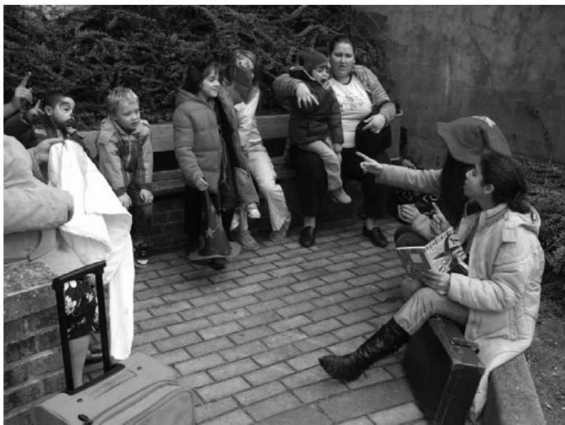
In Elsene houdt een team van het Huis van de Kennis wekelijks een straatatelier met verhalen, boeken en creativiteit.