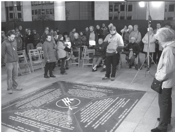
Een moment-opname van de plechtigheid bij de Gedenksteen op 17 oktober 2007.

Alle info up-to-date : http://www.17oktober.be