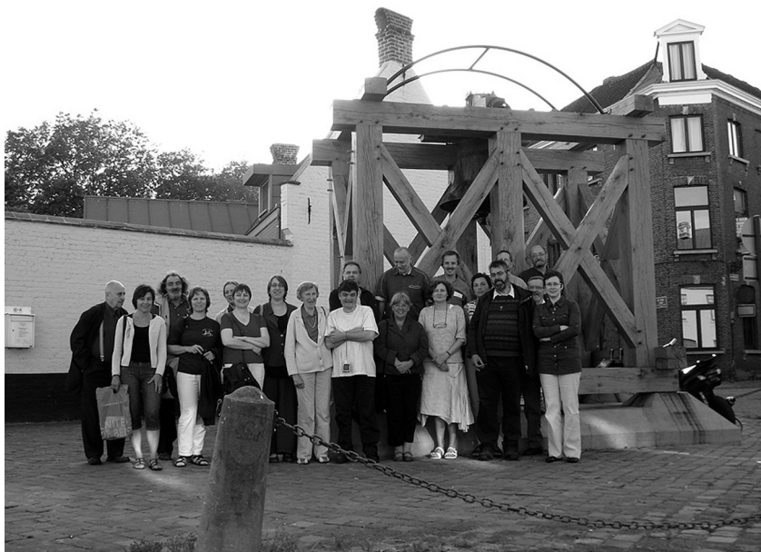
Actieve leden van ATD Vierde Wereld en anderen verzameld rond de Dumeryklok te Brugge.