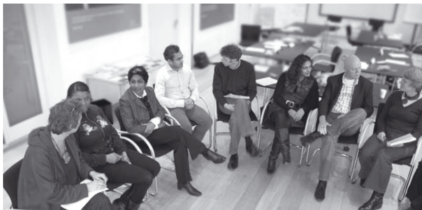
“Het is heel belangrijk te weten of mensen zich veilig voelen op zo’n bijeenkomst.”