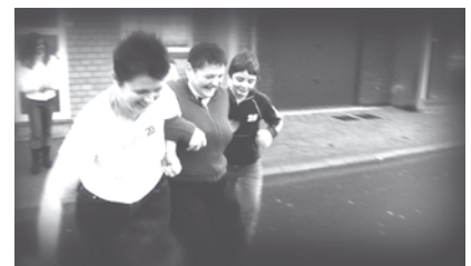
Een scène uit Grensland: "Mijn buuren moesten mij naar het buurthuis sleuren, ik wou niet. Het werd de start van veel nieuwe dingen.".

Vanaf september 2009 komen daar nog eens bij: ondertiteling in het Frans, een infobrochure, een extra filmreportage met wetenschappelijke en politieke duiding en een gespreksleidraad ter ondersteuning van nabespreking of debat.