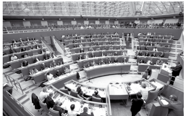
Het Vlaams Parlement in zitting bijeen.

Beroepskrachten. Wat ATD Vierde Wereld vaak van hen hoort is dat zij de armsten wel willen bereiken maar dat het moeilijk is. Kennis over het leven van mensen in armoede moet daarom een ruime plaats krijgen in de basisopleiding en de voorgezette vorming van deze professionelen.