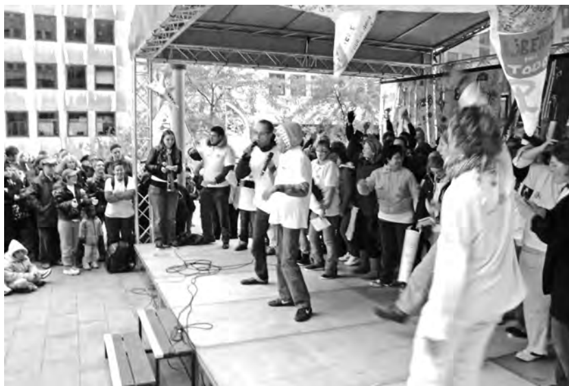
Foto boven : De jongeren doen hun Oproep, gedeeltelijk in indringende 'rap'.