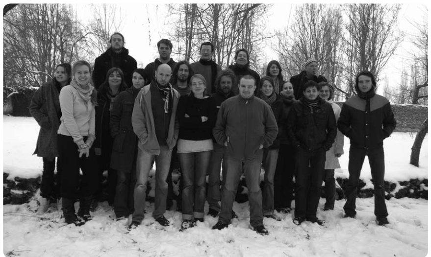
Jongeren uit verschillende landen, ook uit België, verzamelden zich in januari in Champeaux, Frankrijk om plannen te maken voor het Europees Jaar van de Bestrijding van Armoede en Sociale Uitsluiting.