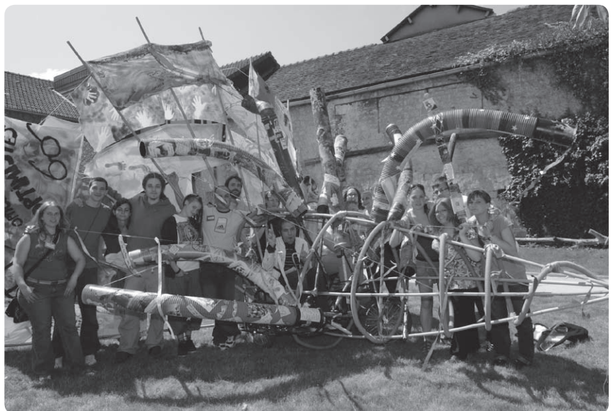
Jongeren uit verschillende landen zijn sinds vorig jaar bezig om voor 2010 een ‘boodschap aan Europa’ te formuleren.