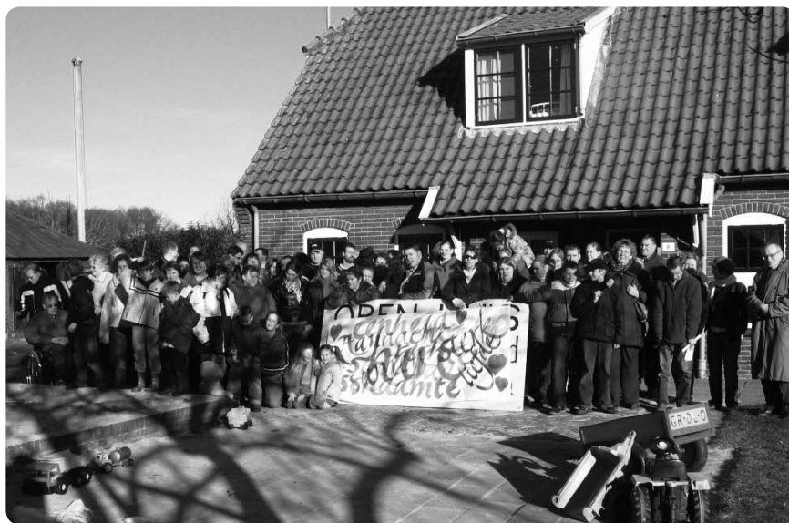
Een gezinsdag op ontmoetingscentrum 't Zwervel in Nederland.

Voor jongeren is er de enquête << Hallo ? Europa ? >>. Sommige jongeren doen mee aan de internationale ontmoetingen, an-