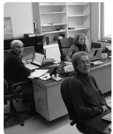
Een deel van het Europa-team in het Vierdewereldhuis in Brussel

(*) beide voorbeelden komen uit: 'Hoe Europa ons leven beïnvloedt' - Hendrik Vos en Rob Heirbaut - Standaard Uitgeverij - 2008